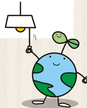
福島県の地球環境保全のキャラクター「エコたん」