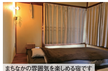
まちなかの雰囲気を楽しめる宿です

最近、徒歩や自転車で市内に観光するお客様が多いと感じています。そういったお客様に、お泊りできるゲストハウスを新たに開設し、地元などに新しい観光の活性化に繋がっていきたくです。