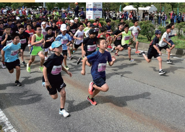
秋の会津路を走りませんか

▼参加賞：大会オリジナルTシャツ ▼申し込み方法：大会公式ホームページ(https://aizu-tsurugajo-marathon.jp/)から専用ページにアクセスして申し込み ▼申込期間：5月1日(水)～6月30日