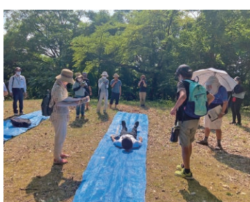
昨年度は、古墳に埋蔵された棺の様子を再現しました

「歩いてみよう大塚山古墳」 ▼とき：5月19日(日)午後1時30分～4時 ▼定員：20人 ▼対象：小学5年生以上の人 ▼ところ：申し込み・問い合わせ：歴史資料センター「まなべこ」(☎27・2705)