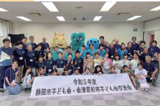
指導児講習会では、3期生になると県外研修に行きます。昨年度は静岡県静岡市や富士急ハイランド(山梨県)に行きました

さまざまな地区の小学4年生から6年生が集まり、3年間でいろいろな経験を積みます。この取り組みは全国で会津若松市子ども会だけが実施されていて、参加した皆さんからは「ほかの学校の友達がたくさんできた」