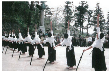
墓前祭では、会津高等学校の剣舞委員会の生徒により、慰霊の剣舞が奉納されます

墓前祭には全国から多くの人々の参拝があり、白虎隊士を偲ぶ参拝者により献じられる線香の白煙は絶えることなく周囲を覆い、歴史的風致を感じることが出来ます。