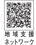
地域支援ネットワークボランティア事業