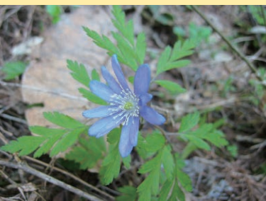
別名「キクザキイチリンソウ」と呼ばれています

「キクザキイチゲ」 キクザキイチゲは、キンポウゲ目キンポウゲ科に属する植物です。多年草で、毎年春に花が咲き、地上の大部分は秋に枯れませんが、小さな芽が地面の下に枯れないで残ります。残った芽は地中で冬を越し、春になって成長します。茎の高さは、10cmから30cmほどです。 葉は、地上茎の根本より葉の付く根生葉で、葉の縁は大きく欠けており、不揃いの切れ込みがあります。花は、茎の先端に1つ咲きます。花の色は淡紫色や白色です。森林や草原などに自生しており、市内では東山地区、鶴ヶ城付近などで見ることが出来ます。