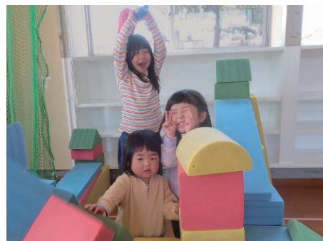
楽しい時間を一緒に過ごしませんか