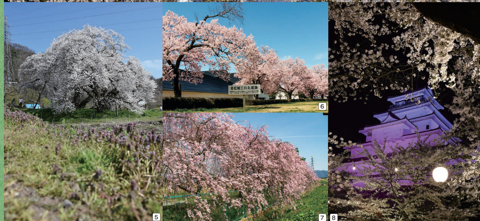
1_子どもの森の桜の枝で羽根を休めるメジロ 2_湯川の河川敷の桜並木 3_子どもの森の上空から撮影した1枚 4_会津大学の北側から望む磐梯山と桜 5_樹齢約650年といわれる石部桜 6_福島県立博物館を囲むタカトオコヒガンザクラ 7_神指町の大川河川敷の桜 8_ライトアップされた鶴ヶ城天守閣とソメイヨシノ

春を彩る市内のさまざまな桜風景を紹介します。 ○問い合わせ…秘書広聴課(☎39-1206)