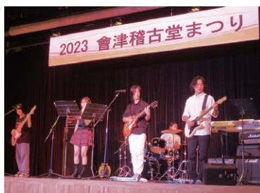
ステージ発表や作品の展示などをしてみませんか