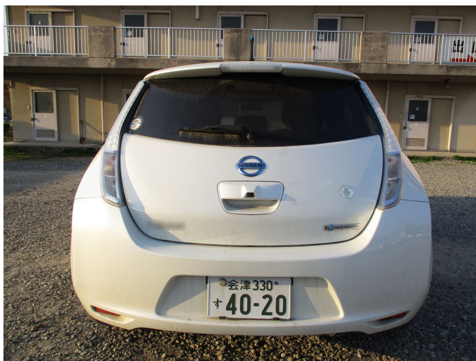
(撮影年月日 令和 5年 4月 3日)