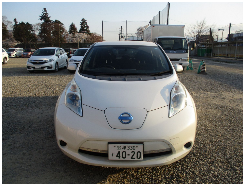
(撮影年月日 令和 5年 4月 3日)